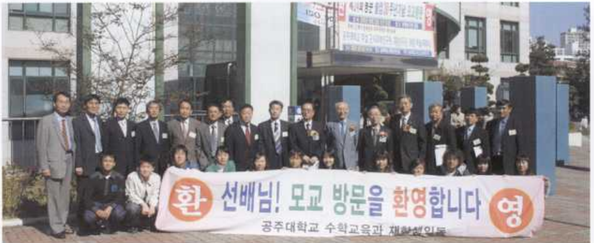
모교방문 선배들을 환영하는 후배들(수학교육과)

제24회 동문 졸업30주년기념 모교방문행사가 지난 10월 22일(토) 모교 연구관 강당에서 열렸다. 이 날 행사는 120여명의 동문과 10여명의 은사가 참석한 가운데 식전행사로 음악교육과 재학생의 바이올린 독주와 독창에 이어 모교 홍보영상 상영으로 지난 30년간 변화된 모교의 모습을 확인하였다.