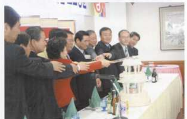
기념 케이크를 절단하는 동문들