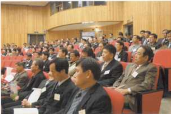
연구관 강당에서 열린 기념식에 참석한 동문들

행사를 마친 후 동문들은 기념사진 촬영을 하고 교직원 식당에서 오찬을 함께 하며 정담을 나누고 우의를 돈독히 했다.