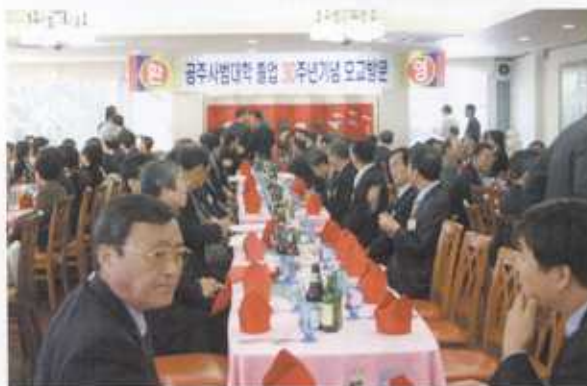
리셉션장에서 정담을 나누는 동문들