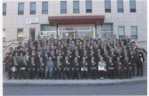
은사님들을 모시고 기념촬영한 동문들