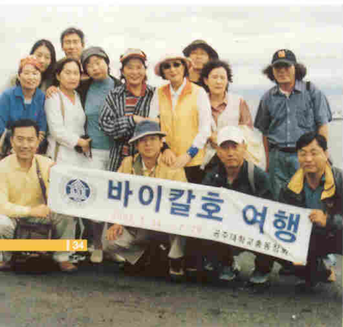
◀ 바이칼호수를 배경으로

바이칼 호수는 이르쿠츠크시 외곽에 위치하며 시베리아의 진주로 불리우며, 최대수심 1,742m, 최대폭 79km, 수면면적 31,500 m^2 으로 세계 담수의 1/5를 담고 있으며 호수 자체의 아름다운 경관과 주위에는 침엽수림대인 타이거 지대가 끝없이 펼쳐져 있다. 또한 바이칼 호수는 오염이 되지 않아 물을 그냥 식수로 사용하고 있으며, 호수 수심