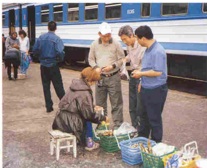
▶ 시베리아 횡단열차가 정차하는 역에서 특산물을 파는 모습(슬라비앙카 역)