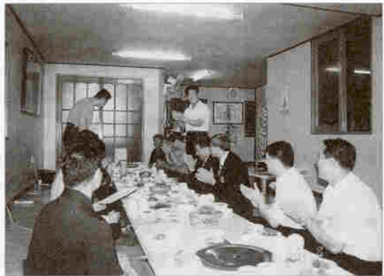
▲ 최고지도자과정(대전지부) 임원진과의 간담회 모습(8/8)