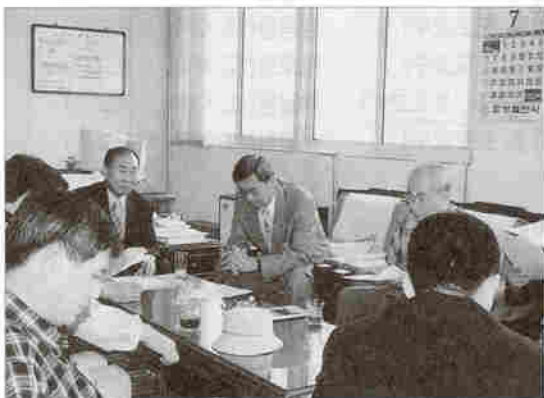
▲ 강원지부 순방시 협의회 모습(7/15)