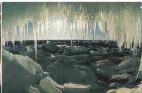
▲ 얼음으로 덮힌 겨울의 바이칼