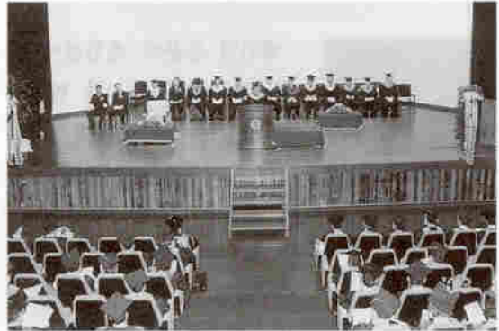
▲ 후기 학위수여식 모습