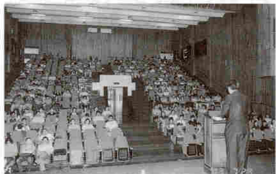
▲ 자격연수생을 위한 특강 모습

모교에서는 기숙사를 개방함은 물론 각종 편의시설을 최대한 제공하여 연수생들에게 보다 좋은 여건에서 연수를 받을 수 있도록 배려하 는 등 많은 지원을 한 바 있다.