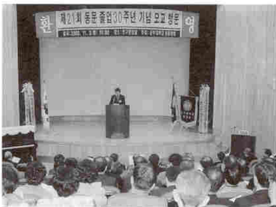
▲ 21회 동문 모교방문 행사(2002. 11. 3)