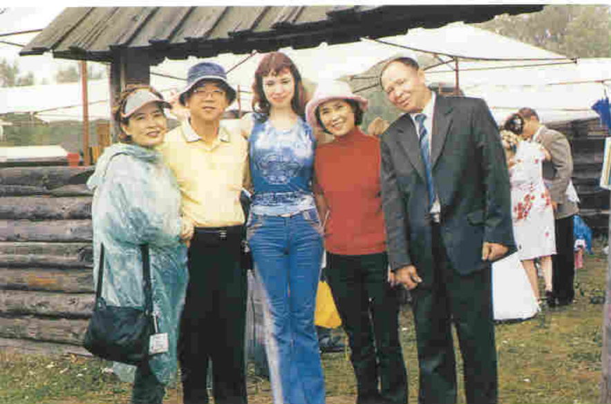
◀ 러시아 전통결혼식을 마친 하객들과 함께 ▶ 콘바이칼 열차기 경치좋은 호수 앞에서 정차할 때 호수를 배경으로...