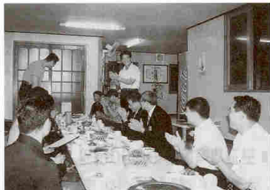
▲ 최고경영자과정(부여지구) 임원진과의 간담회 모습

동창회관 건립에는 최고경영자 과정 및 최고지도자 과정, 최고농업경영자 과정의 동문들도 적극적인 협조를 약속하고 있다. 추진위원회에서는 이들 과정의 임원들을 추진위원으로 위촉하였으며, 이미 이들 동문들도 기금 마련에 적극적으로 앞장서고 있다. 대학 졸업 동문을 능가하는 애정과 열의에 감탄, 그리고 감사할 따름이다.