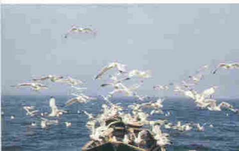
▲ 바이칼 호수의 갈매기떼