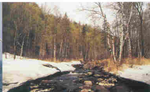
▲ 시베리아 자작나무 숲