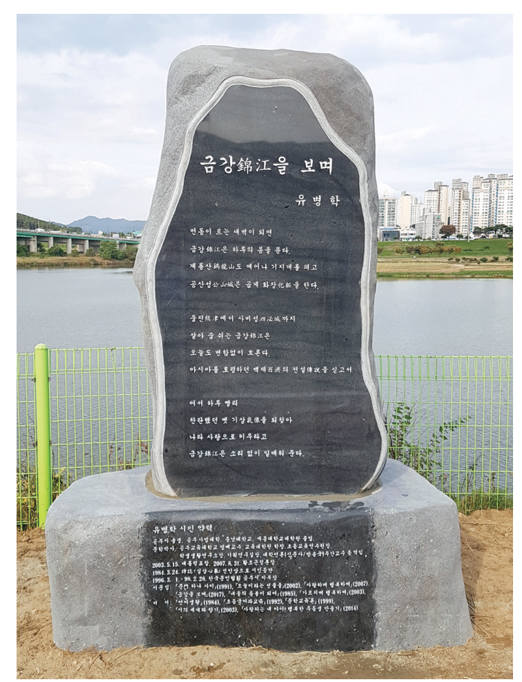
〈시비(詩碑)는 공산성 금강교 옆 금강공원에 설립되어 있음

《금강을 보마》는 한국 4대강을 읊은 시들은 많은데, 오로지 우리 금강만이 그 이름다움을 읊은 시와 시비가 없어서 공주시가 내 고장 시랑의 일환으로 추천하여 시비까지 세워진 작품입니다. 우리 고장 공주시의 상징이기도 한 〈금강〉은 한때 모교대학의 교지 이름이기도 하였습니다. 하 여, 동창화원님들의 모교가 있는 공주시와 학창사절의 추억들을 떠올릴 작품이라고 생각됩니다