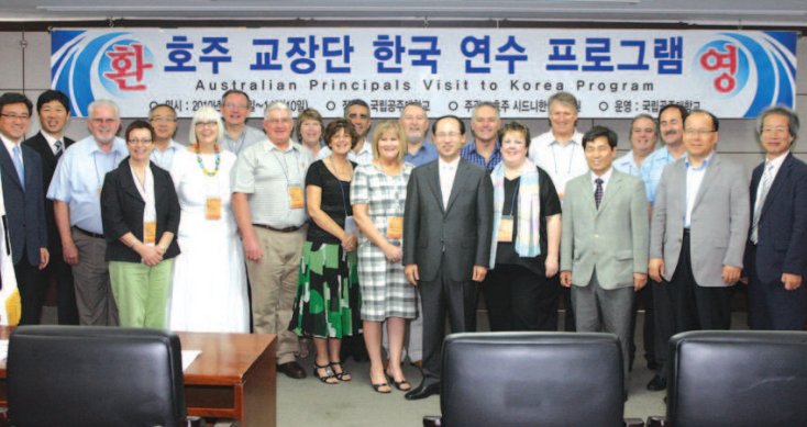
입교식 후 기념촬영

는 한국방문 및 문화체험 연수 프로그램으로 7월 5일부터 7월 14일까지 9박 10일간 진행되었다. 특히, 이들 교장단들은 공주의 무령왕릉과 공산성, 판소리 체험 등 역사 유적지 방문과 한국민속촌도 방문하여 다양한 문화체험의 기회를 가졌다.